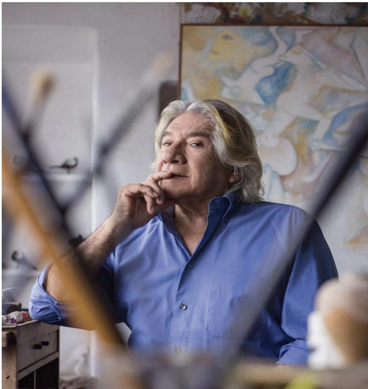
Exposición del artista plástico Gerardo Chávez